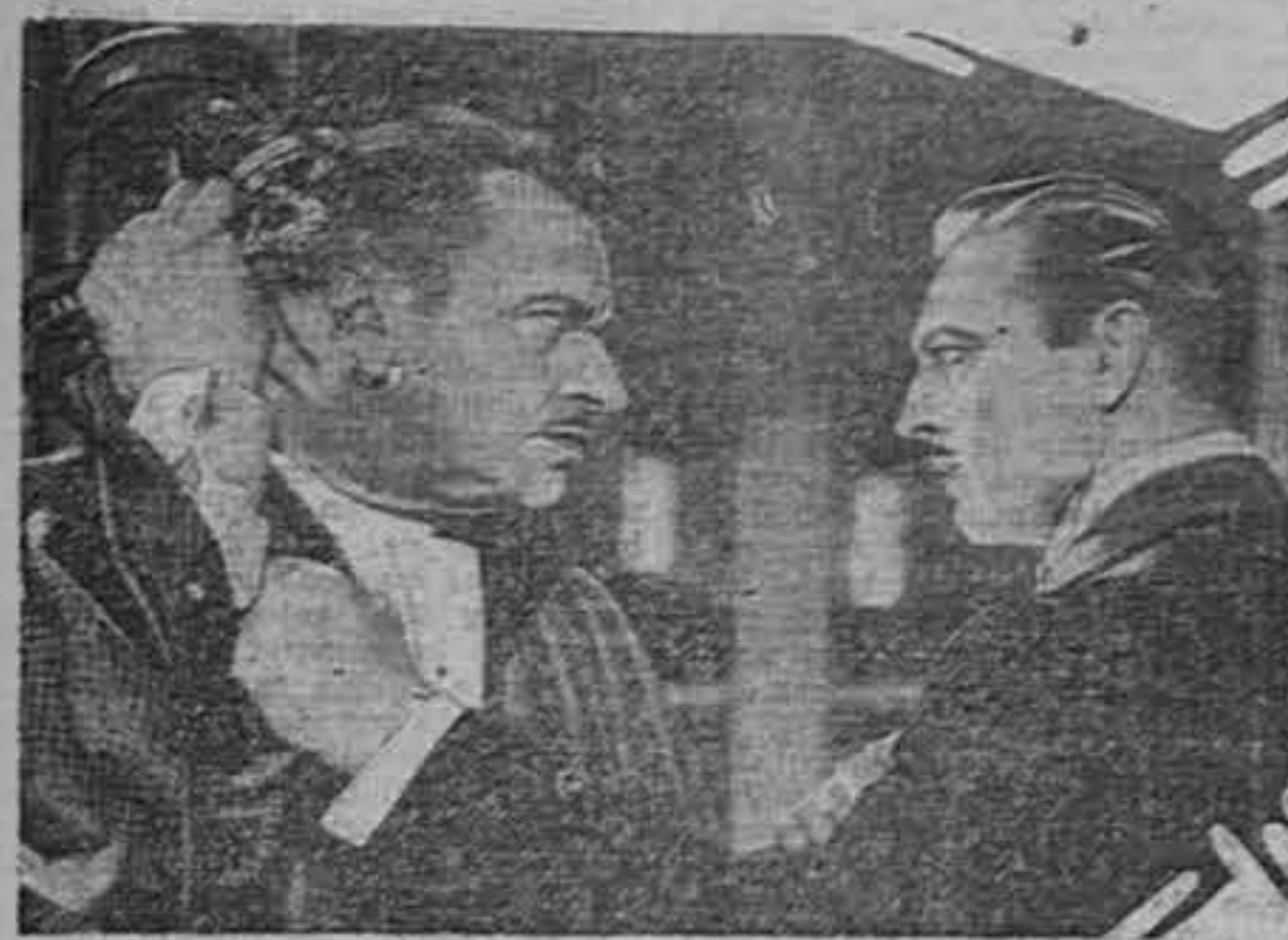
WALLACE BEERY and JOHN BARRYMORE in "GRAND HOTEL"

El suceso extraordinario del próximo domingo. — Estreno en los Teatros Variedades, América y Adela de la asombrosa super-film de Metro Goldwyn Mayer: "GRAN HOTEL"